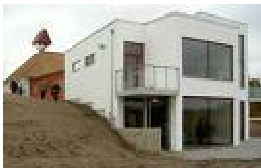
Teckningsmuseet i Laholm